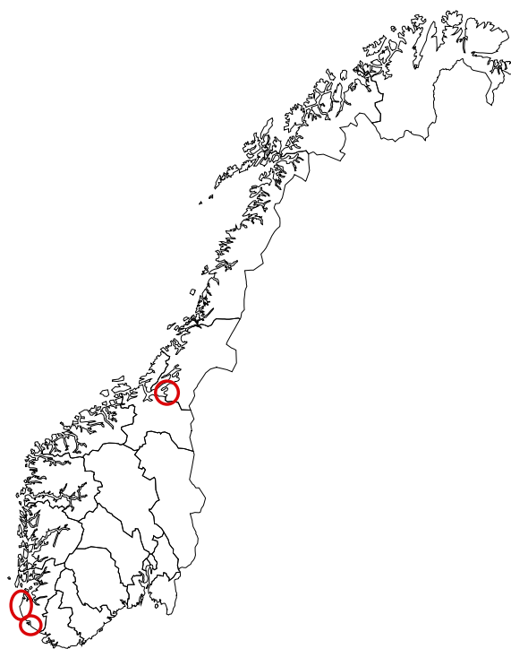
Områder med større angrep av hvit PCN, markert med røde ringer.

Så langt man kjenner til er hvit PCN påvist på et 30-tall lokaliteter fra Grimstad i sør til Stjørdal i nord, flere av dem på villatomter. Foruten sistnevnte lokalitet finner vi også store forekomster i Eigersund og på Jæren. Hvit PCN har lavere temperaturgrense for klekking og utvikling enn gul PCN, og kan forventes å kunne utvikles godt i nordlige og kjøligere strøk av landet.